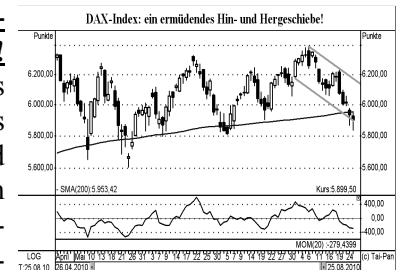
DAX-Index: noch immer sicher über seinem 20-Monatsdurchschnitt